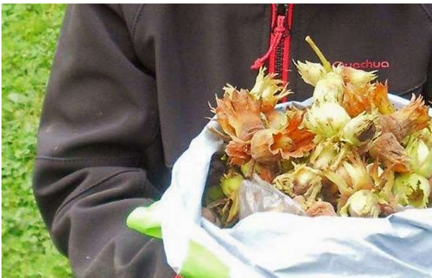
Kindergartenkinder haben im Wald Haselnüsse gesammelt.